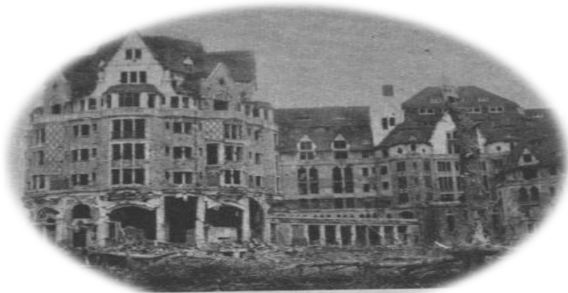
Vue du Royal Picardy avec ses colonnes

Le nom de l'hôtel fictif servant de base pour l'épreuve d'hébergement du « Trophée National Royal Picardy » est donc « L'Hôtel Royal Picardy » en mémoire du plus bel hôtel du Monde détruit dans les années 60.