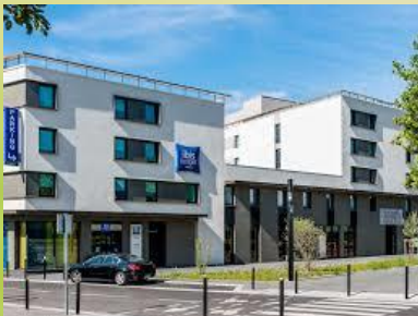
Ibis budget Vélodrome