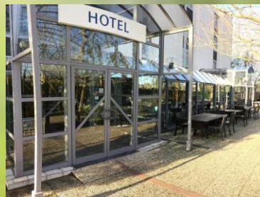
Best western Paris St Quentin