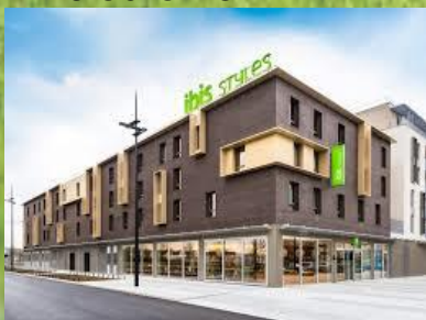
Ibis style Guyancourt