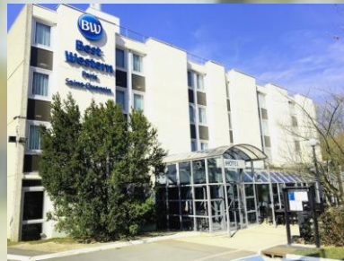
Best Western Guyancourt