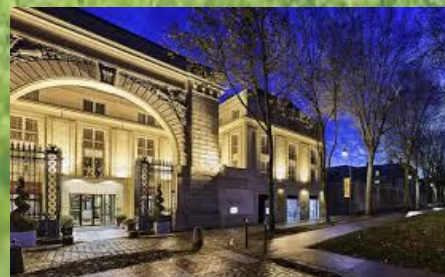
M Galery Versailles