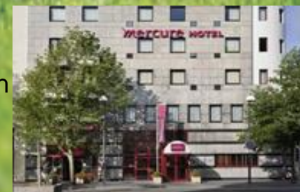
Mercure St Quentin en Yvelines