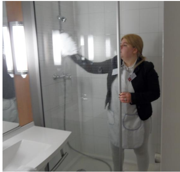
Nettoyage de la salle de bain pour une chambre à blanc