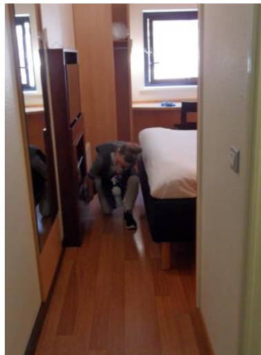
Remise en état d'une chambre à blanc