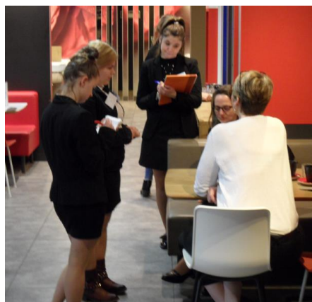
Préparation et service petit déjeuner