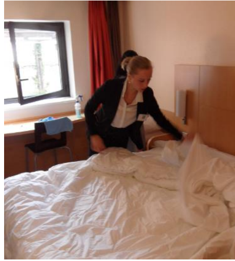
Remise en état d'une chambre à blanc