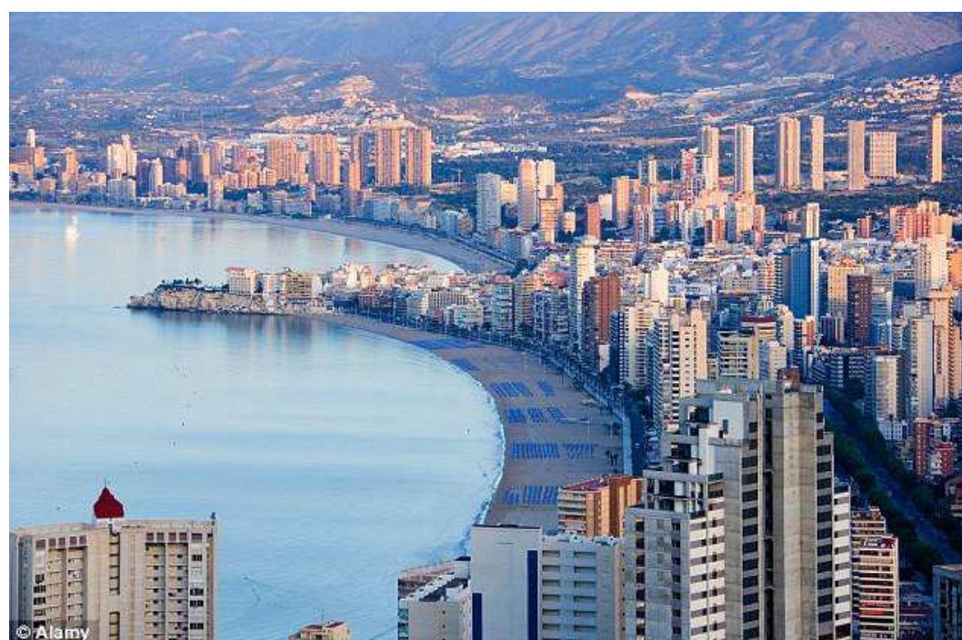
In : http://www.dailymail.co.uk/travel/article-2292292/Benidorm-holidays-Back-Spanish-resort-deserves-second-look.html 13 mars 2013