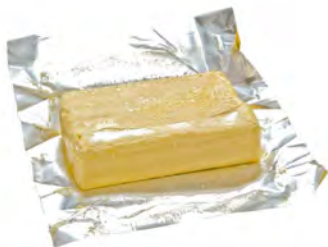
BEURRE DOUX PLAQUETTE 0,5 Kg Référence : 02.145