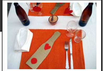
Table de 2 personnes