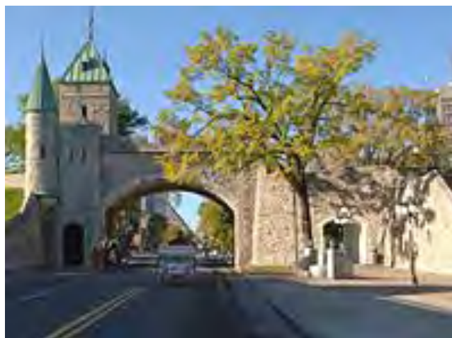
Porte fortifiée de Québec

En inscrivant Québec sur sa liste, il y a maintenant 25 ans, l'Unesco a voulu reconnaître sa valeur universelle exceptionnelle. Berceau de la civilisation française en Amérique, l'arrondissement historique du Vieux-Québec témoigne, par son architecture et ses paysages urbains, du rôle qu'a joué la ville à titre de capitale sous les régimes français, britannique et canadien. Place forte stratégique durant près de trois siècles, Québec a conservé les principales composantes de son ancien système de défense, ce qui en fait la seule ville d'Amérique du Nord entourée d'une enceinte de fortifications authentique.