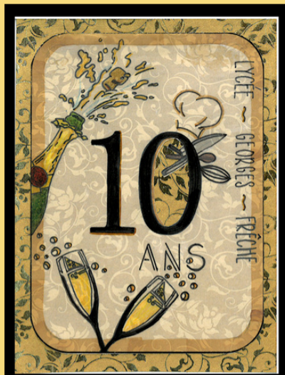
Illustration : Ludmilla LAGET GIRARD, classe 1PH2