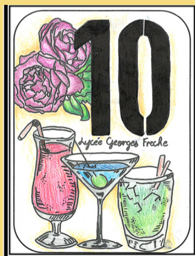
Illustration : Lou SIRVENT, classe 2PH3