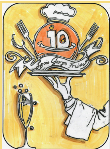
Illustration : Houcine AKBABAI, classe 1CAPPAT2