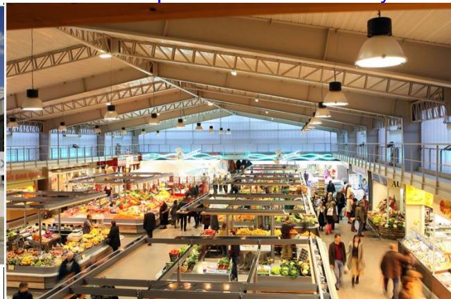
55/67 2013 : La place Charles III et le marché Couvert de la place.