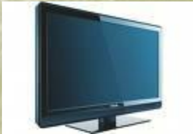
TV écran plat