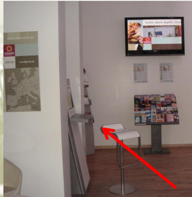
Localisation de la borne