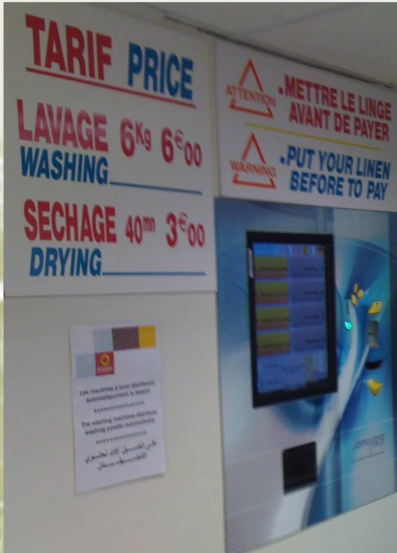
Distributeur de jetons